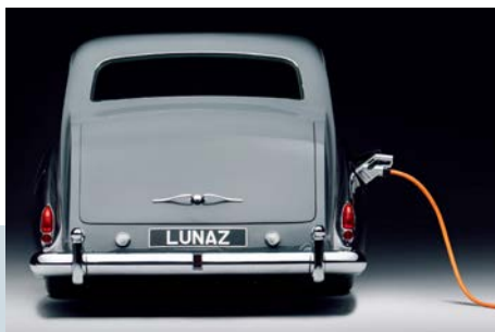
Het Britse LUNAZ bouwt klassieke Jaguars en Rolls-Royces om naar elektrische aandrijving.