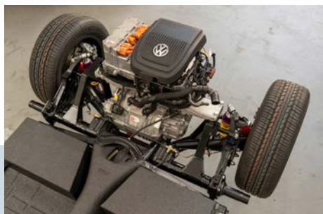
Er zijn al diverse bedrijven in de wereld die oude VW Kevers van elektromotoren voorzien.

vertalen naar de waarde van de hele auto? Dat wordt opgelost door de totale investering van ombouw te nemen met een kleine plus voor de nostalgische verpakking en daar een afschrijving van pakweg vijf jaar op los te laten. Omgebouwde brommers en motorfietsen staan op 74 stuks, waarvan acht motorfietsen. Wel zijn het allemaal driewielers of met zijspan, want je moet de accu's toch ergens laten. Het aantal brommers staat op 66: bijna de helft bestaat uit origineel elektrisch aangedreven brommertjes uit 1973.