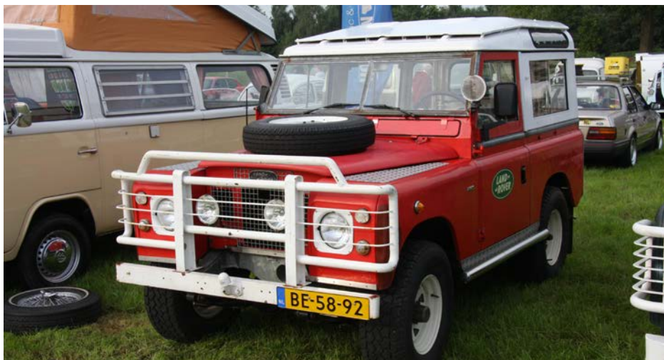
Terschelling behoort tot de gemeenten met de hoogste oldtimerdichtheid, mede dankzij de vele Land Rovers.

De stijging van het aantal 40-plussers heeft een paar oorzaken. Het gaat economisch weer beter in Nederland en het aantal geïmporteerde klassieke voertuigen neemt toe; dat is af te lezen aan het tempo waarin de DZ-kentekenserie voor klassieke 40+ auto's wordt afgegeven. Daarnaast komt steeds een nieuwe jaargang origineel Nederlandse auto's op leeftijd en bereikt de 40 jaar-grens. Natuurlijk heeft ook de per 1-1-2014 naar 40 jaar opgetrokken vrijstelling Motorrijtuigenbelasting invloed: een oldtimer met blauwe kentekenplaten zonder belastinggedoe is toch leuker dan eentje met gele platen plus de overgangsregeling. Het dalende aantal 25 tot 40-jarigen heeft ongetwijfeld te maken met het veranderde belastingregime, de beperkingen voor diesels in milieuzones en