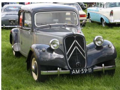
Nederland telt nu 141.000 klassiekers van 40 jaar en ouder.

Het CBS meldde vorige maand dat het aantal oldtimers in Nederland toeneemt. Dat is juist als je de grens bij 40 jaar legt, maar niet als 25 jaar de grens is.