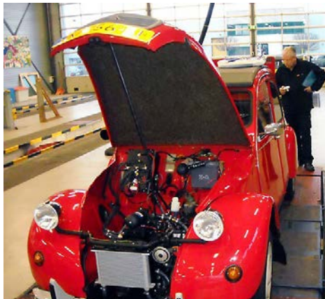
Een 2CV is eenvoudig om te bouwen naar accu-aandrijving.

Rond 1900 leek de elektrische auto de toekomst te hebben: die reed harder dan een benzine- of stoomauto, was betrouwbaarder en schakelen hoefde niet. In 1914 reden er in Amsterdam 60 elektrische taxi's rond. Maar de benzineauto deed het uiteindelijk beter, werd krachtiger en reed harder. De elektrische auto's verdwenen en de overblijvers van toen zijn met de stoomauto's nu rariteiten in de automobielmusea. Nu zijn er maar heel weinig elektrische auto's in het oldtimerbestand: volgens de RDW staan er welgeteld 28 stuks van 30 jaar en ouder in het kentekenbestand. Het zijn bovendien voor het merendeel omgebouwde benzineauto's. Ombouw van benzineauto naar elektrisch blijft een zeldzaamheid en biedt geen echt alternatief voor de benzineauto. Het is vanuit het behoud van mobiel erfgoed ook af te raden: een stoomlocomotief of een DC-3 vliegtuig valt ook niet om te bouwen naar elektrisch.