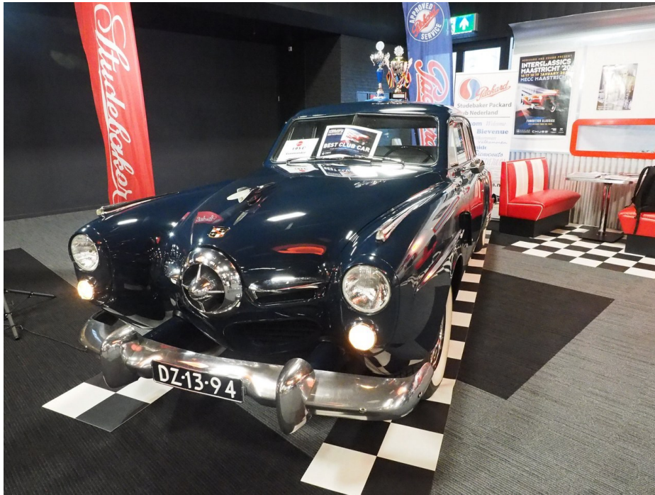
De mooiste clubauto Studebaker Commander 1950 op de een na mooiste clubstand