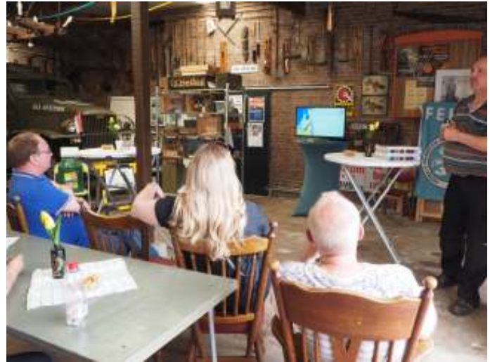
Presentatie tijdens de afsluiting conversietraject landbouwvoertuigen

Tijdens de conversie van de (land)bouwvoertuigen kwam de projectgroep gedurende enkele jaren maandelijks digitaal bij elkaar. De projectgroep bestond uit mensen van Ministerie, RDW en diverse belangenorganisaties waaronder FEHAC. Tijdens de afsluiting in Valkenswaard zagen sommige mensen elkaar voor het eerst in levende lijve. Deze bijeenkomst werd door FEHAC georganiseerd.