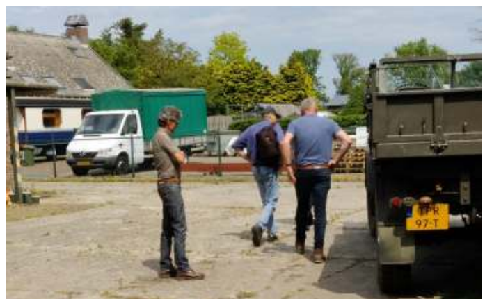
Enkele leden van projectgroep bij een als (land)bouwvoertuig gekentekend voertuig. Om hiermee te rijden is een T-rijbewijs noodzakelijk.