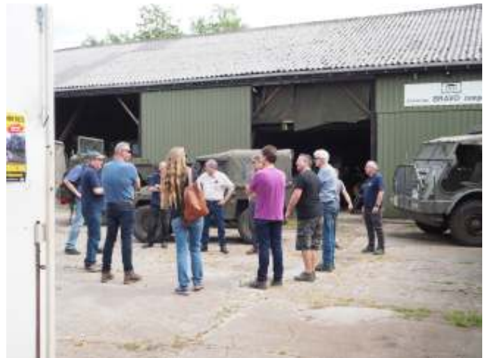
Enkele leden van de projectgroep