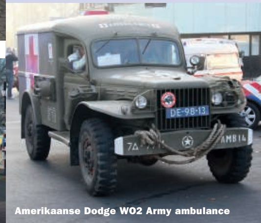
Amerikaanse Dodge W02 Army ambulance