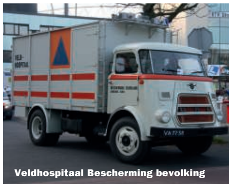
Veldhospitaal Bescherming bevolking