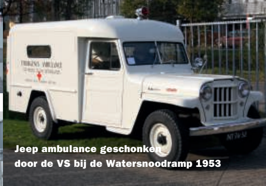
Jeep ambulance geschonken door de VS bij de Watersnoodramp 1953