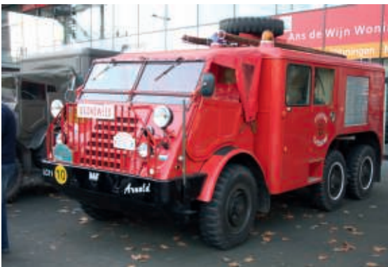
DAF YA 328 leger brandweerauto