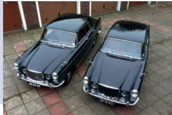
Bij dezelfde auto's, maar van andere eigenaren gaan er toch verschillen ontstaan