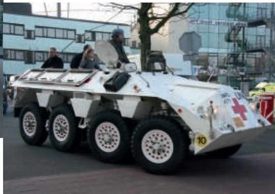
DAF YA 408 gewondenbak Unifil Libanon