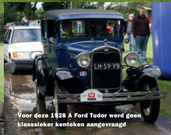
Voor deze 1928 A Ford Tudor werd geen klassieker kenteken aangevraagd