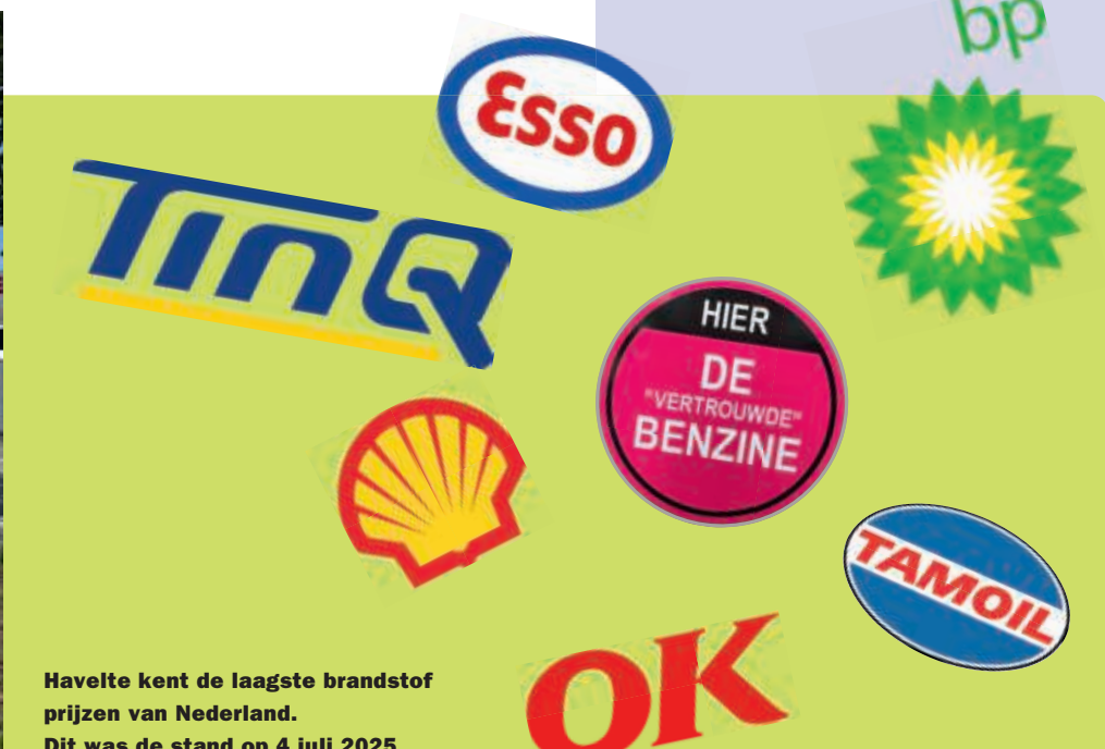
Havelte kent de laagste brandstof prijzen van Nederland. Dit was de stand op 4 juli 2025