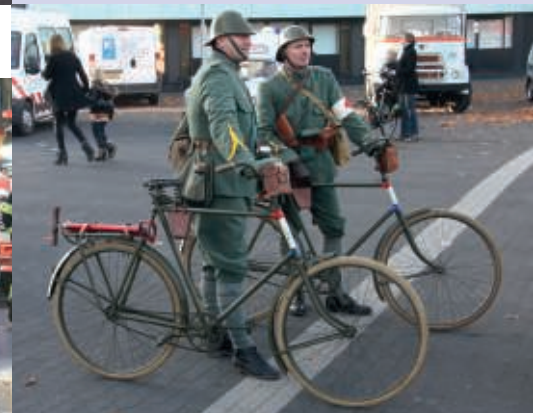
Gewonden verzorgers Korps Wielrijders