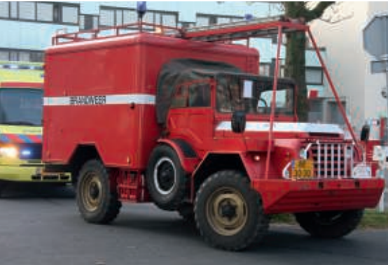
DAF YA 126 brandweerwagen van het leger