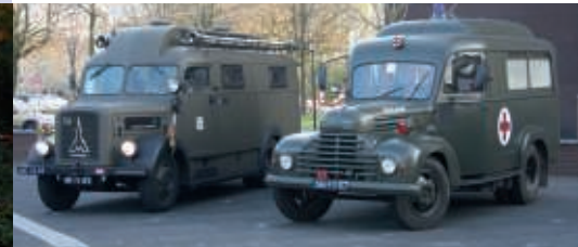
Magirus-Deutz S3500 en Ford Köln 1955