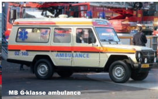
MB G-klasse ambulance