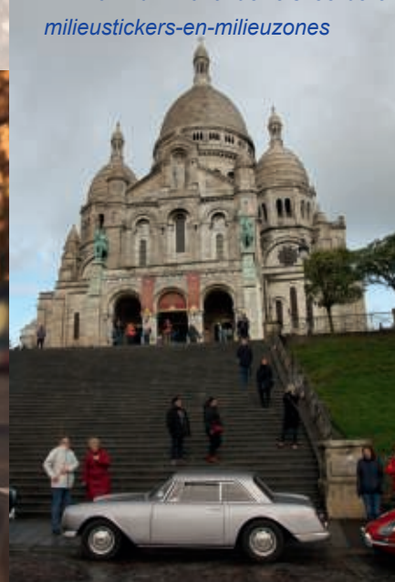
Facel Vega Facellia voor de trappen van de Sacre Coeur in Parijs