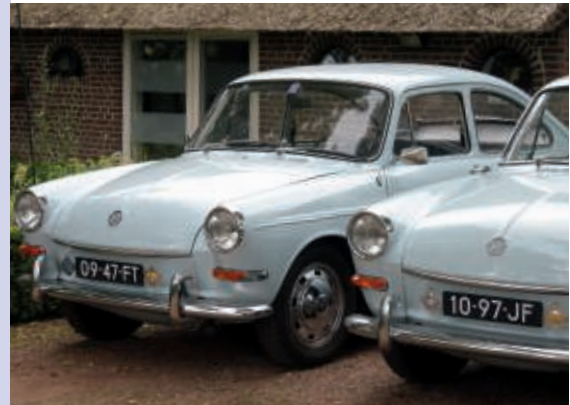
Met Wagenwacht en ANWB schildjes zijn de Volkswagens uit 1968 en 1969 identiek gemaakt

Wat nog wel een tweeling is, maar dan wel twee-eiig, is dezelfde auto, in dezelfde kleur maar dan van verschillende eigenaren. Dan zie toch dat in de loop der tijd verschillen ontstaan in het interieur en uitvoering. Die vergelijking is ook nog door te trekken naar