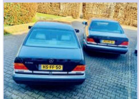
Identieke auto's met opvolgende kentekens: dat is een echte een-eiige tweeling

drie- en meerlingen. Zeker bij liefhebbers van bromfietsen, motorfietsen, tractoren en legervoertuigen komt dit voor. Een bijzonder fenomeen hierbij is nog badge-engineering. Technisch dezelfde auto's worden iets anders uitgevoerd en krijgen een andere merknaam. Met net een iets ander neusje, andere bumpers en een verschillende achterkant wordt er een net iets andere doelgroep bediend. Vooral in Engeland wist BMC met Austin, Morris, Riley, Wolseley en Vanden Plas daar wel raad mee. Laten we dit een meerling met verschillende vaders noemen.