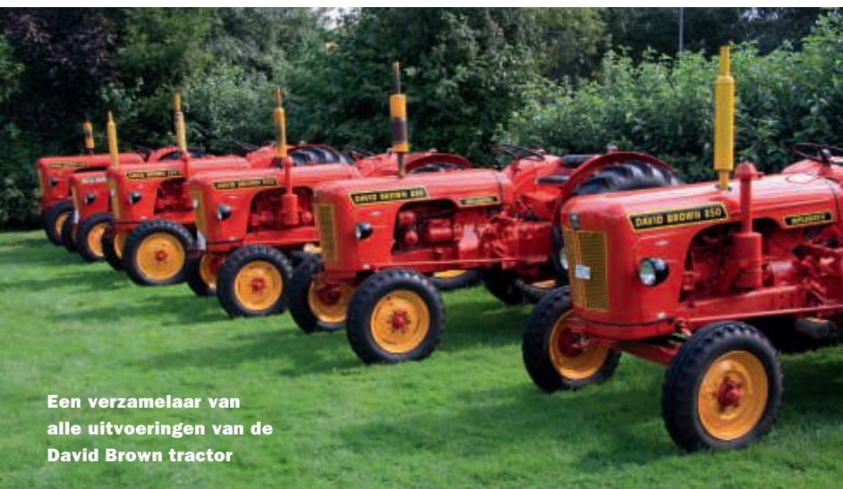
Een verzamelaar van alle uitvoeringen van de David Brown tractor

drie- en meerlingen. Zeker bij liefhebbers van bromfietsen, motorfietsen, tractoren en legervoertuigen komt dit voor. Een bijzonder fenomeen hierbij is nog badge-engineering. Technisch dezelfde auto's worden iets anders uitgevoerd en krijgen een andere merknaam. Met net een iets ander neusje, andere bumpers en een verschillende achterkant wordt er een net iets andere doelgroep bediend. Vooral in Engeland wist BMC met Austin, Morris, Riley, Wolseley en Vanden Plas daar wel raad mee. Laten we dit een meerling met verschillende vaders noemen.