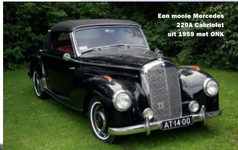
Een mooie Mercedes 220A Cabriolet uit 1959 met ONK

Naast de speciale series voor import klassiekers zijn er natuurlijk ook nog de origineel Nederlandse kentekens: de ONK's in vakjargon. Er is een speciale verzamelaarsite voor juist deze categorie kentekens uit de sidecodes 1 (letters vooraan), sidecode 2 (letters achteraan) en sidecode 3 (de twee letters in het midden). Foto's naar onkbeheer@gmail.nl sturen van een voertuig met een ONK-kenteken erop vinden ze prachtig! Er staan inmiddels 270.000 foto's van ONK's in hun bestand. Veel oldtimerliefhebbers vinden een ONK-voertuig net even iets begerlijker vanwege de Nederlandse historie, dan eenzelfde auto, motor of bedrijfswagen met een klassiek importkenteken. Het zou nog wel eens aardig zijn uit te zoeken hoeveel ONK's er nog zijn, tegenover het aantal voertuigen met een importkenteken.