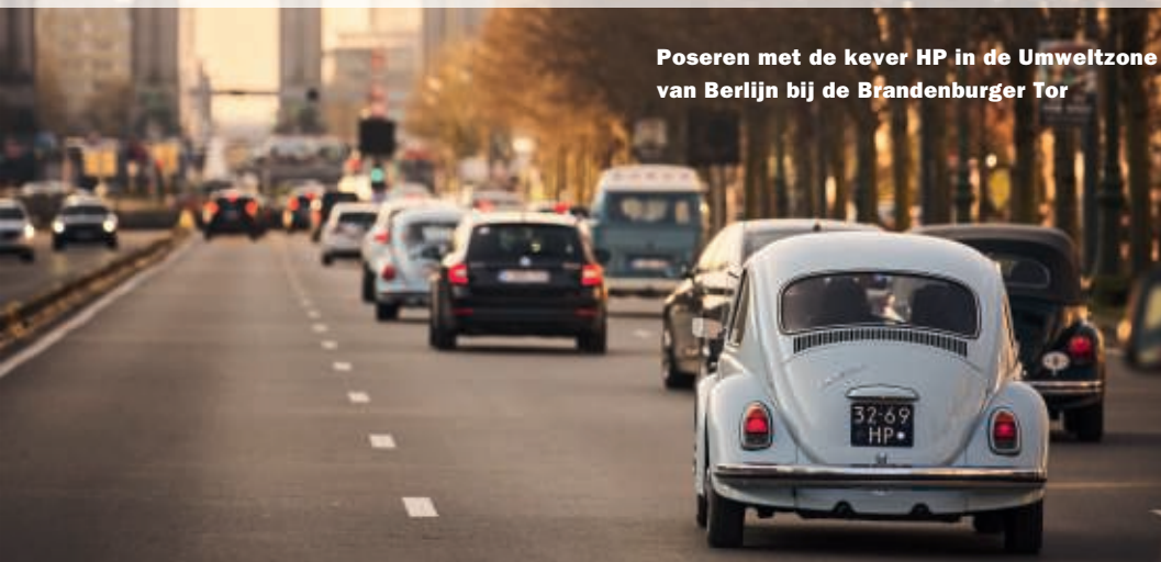
Poseren met de kever HP in de Umweltzone van Berlijn bij de Brandenburger Tor

www.anwb.nl/vakantie/reisvoorbereiding/milieustickers-en-milieuzones