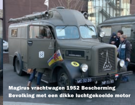
Magirus vrachtwagen 1952 Bescherming Bevolking met een dikke luchtgekoelde motor