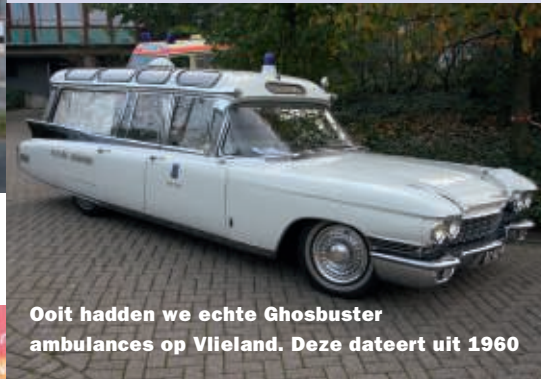
Ooit hadden we echte Ghosbuster ambulances op Vlieland. Deze dateert uit 1960