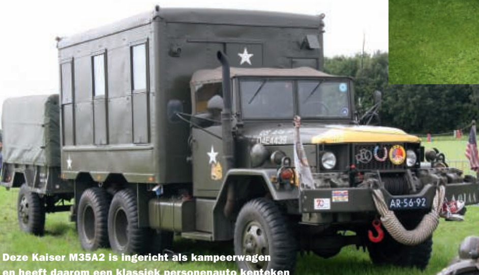
Deze Kaiser M35A2 is ingericht als kampeerwagen en heeft daarom een klassiek personenauto kenteken

Voor de klassieke import auto's worden jaarlijks rond de 1.850 stuks klassieker kentekens uitgegeven. Dus één zo'n serie gaat dik vijf jaar mee. Per 12 juli 2025 was de RDW tot de uitgifte van de PM-99-86 gekomen en waren er nog 13 kentekens te gaan. We verwachten de opvolgende serie - die met de letters RM gaat beginnen - rond 16 juli 2025 en dan komt de RM-00-01 op de weg.