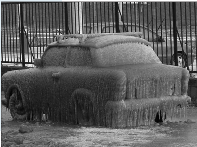
86 procent van de klassiekers wordt in een garage gestald en komt 's winters nauwelijks buiten: dat geldt voor deze Trabant kennelijk niet....