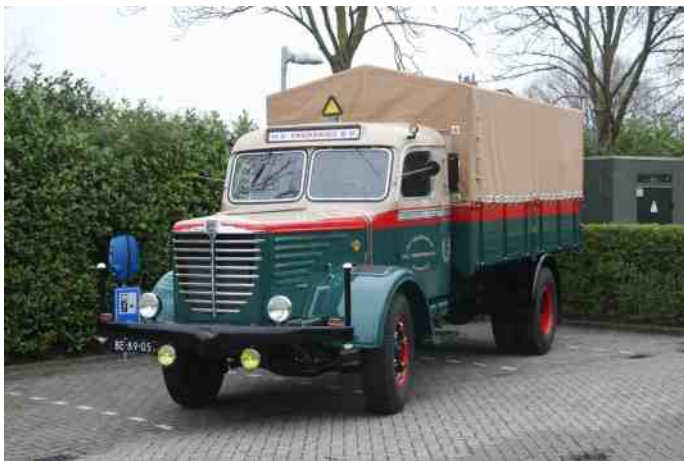
De Büssing van de Taxatievakdag was vier laadplekken groot

Een onderdeel van het wetsvoorstel trekkerregistratie is de APK vrijstelling voor voertuigen ouder dan 50 jaar. Deze vrijstelling kan NIET ingaan voordat het voorstel is aangenomen.