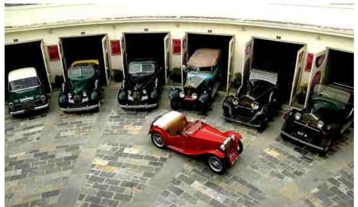
Het kennisblad Opslag en Stalling staat inmiddels op de FEHAC Kennisbank

Het plan is om een Contactgroep Duurzaamheid op te zetten met personen die niet in de commissie zelf willen zitten maar wel hun expertise ter beschikking willen stellen.