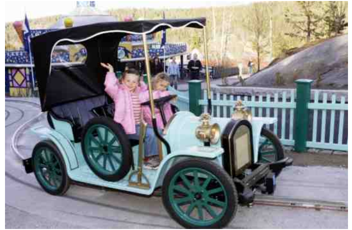
De lol in oldtimers kan niet vroeg genoeg beginnen